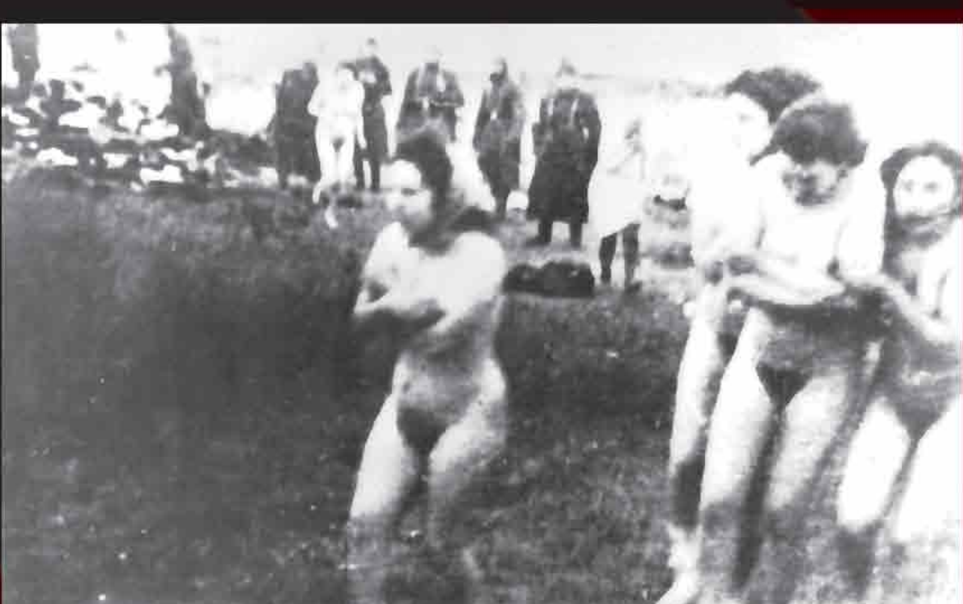
Execution of Jewish women in Liepaja, Latvia, December 15, 1941.

IN THE SPRING OF 1941, THE SS organized four mobile killing squads (Einsatzgruppen) for the occupied Soviet Union and Baltic regions. These specifically trained murder units followed invading troops to capture and eliminate “Jews, Communists, and other Soviet officials.” Hitler, distrustful of the will of his generals to carry out his intended “war of annihilation,” appointed Heinrich Himmler to carry out “special tasks” on the eastern front.