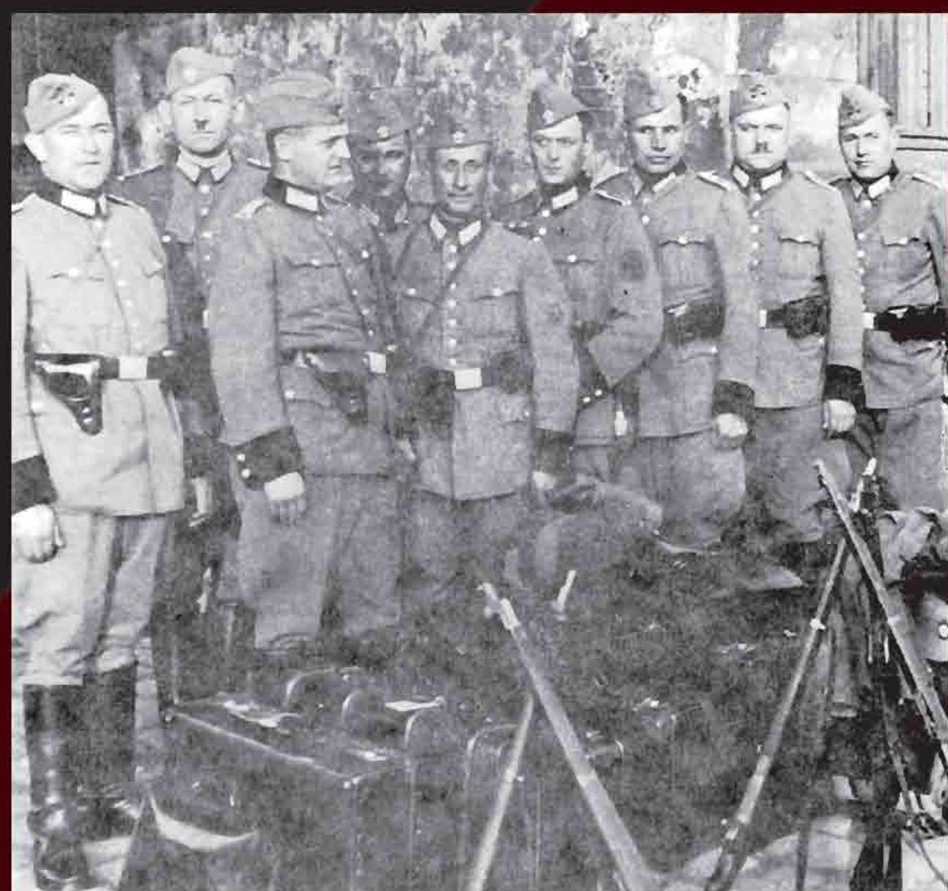
Mobile killing squad in the eastern Galician town of Drohobycz, Autumn 1941.

“The place of the execution was isolated in order to avoid that the civilian population would unnecessarily become witness of a spectacle...The execution commando [Exekutionskommando] ...was posted on the other side of the anti-tank ditch and the persons which were designated to be executed were shot dead from behind as quickly as possible.”